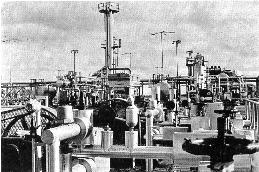
Aufbereitungsanlagen auf Erdgasfeldern in Annerveen (Drente/Holland)

zung des Rheins bei Möhlin bis zum Griespass auf 2400 m ü. M. an der schweizerisch-italienischen Grenze. Von der gesamten Leitungslänge von 164 km liegen 30 km in Stollen und Schächten. Ungewöhnlich waren auch die administrativen Probleme, berührt die Leitung auf ihrem Weg durch die Schweiz doch das Gebiet von sieben Kantonen und 52 Gemeinden und den Besitz von 1060 Grundeigentümern, so dass es allseits viel Verständnis und den guten Willen aller Beteiligten brauchte, um das Werk in zweckentsprechender Weise realisieren zu können. Ungewöhnlich ist schliesslich auch die Sicherheit dieser Leitung, die den sehr strengen Anforderungen der eidg. Rohrleitungsgesetzgebung genügen musste, aber auch die Umweltfreundlichkeit ihrer Anlage und der von ihr transportierten Energie. Verständlich deshalb der Dank der Bauleitung nicht nur an Behörden und Grundeigentümer, sondern auch an die 37 daran beteiligten Unternehmungen mit über 2000 Arbeitern aus 15 Nationen.