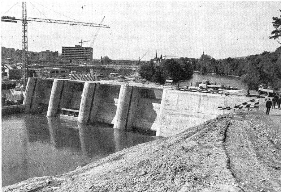
Bild 4 Stauwehr des Reusskraft- werkes Bremgarten-Zufikon, oberwasserseitig.