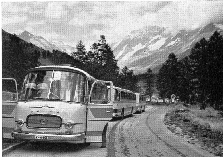
Bild 6 Startbereite Cars zuhinterst im Löttschentale; Blick auf Grosshorn, Löttschenlücke und Schienhorn.