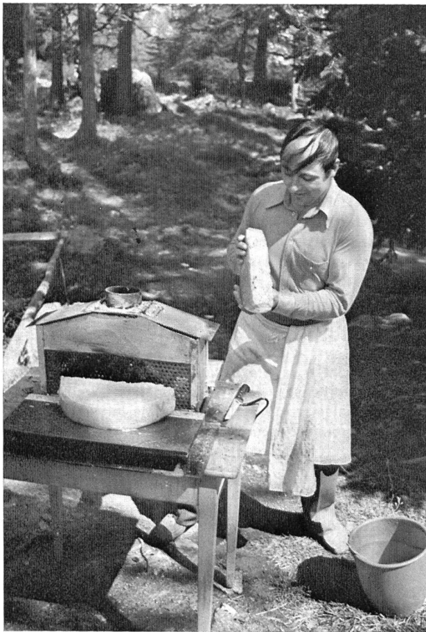
Bild 4 Vorbereitungen für die ausgezeichnete mundende Raclette.