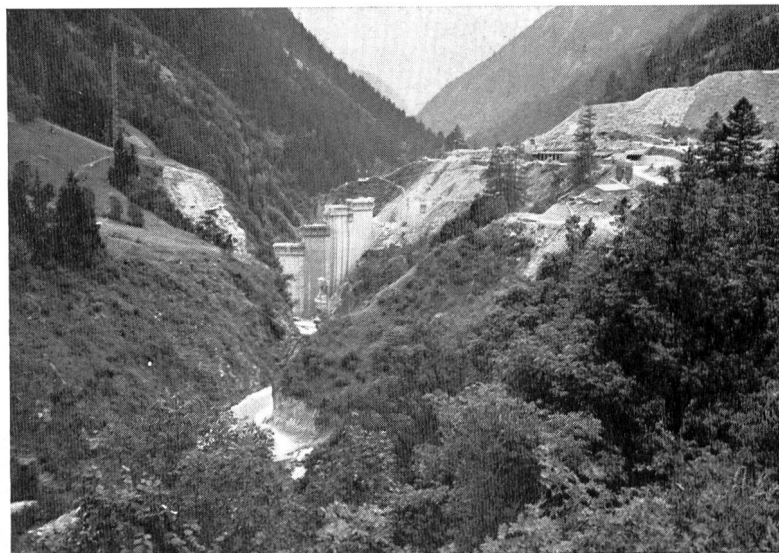
Bild 7 Die im Entstehen begriffene Talsperre Ferden im Löttschentale.

Bietschhorn, dem König des Rhonetals, auf 3950 m ü.M. Sie ist bedeckt mit dunklen Tannenwäldern. Die rechte Talseite, ‚sunnuhalb‘ sagt der Löttscher, ist weniger steil und auch weniger hoch (3200 m ü.M.), im Osten erreicht auch sie 3800 m ü.M., sie trägt vorwiegend Lärchenwald.