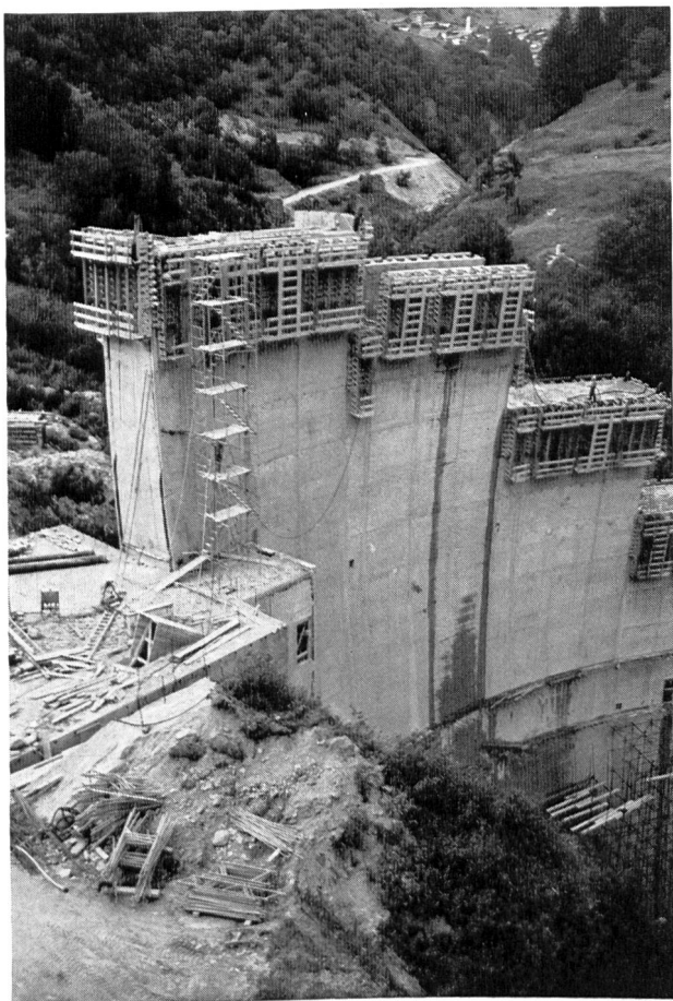
Bild 8 Talseitige Sicht der 67 m hohen Bogentalsperre Ferden; im Hintergrund das Dorf Ferden.

Die linke Talseite, ‚schattihalb‘ wie der Löttscher sagt, steil abfallend und von Runsen durchzogen, erhebt sich im