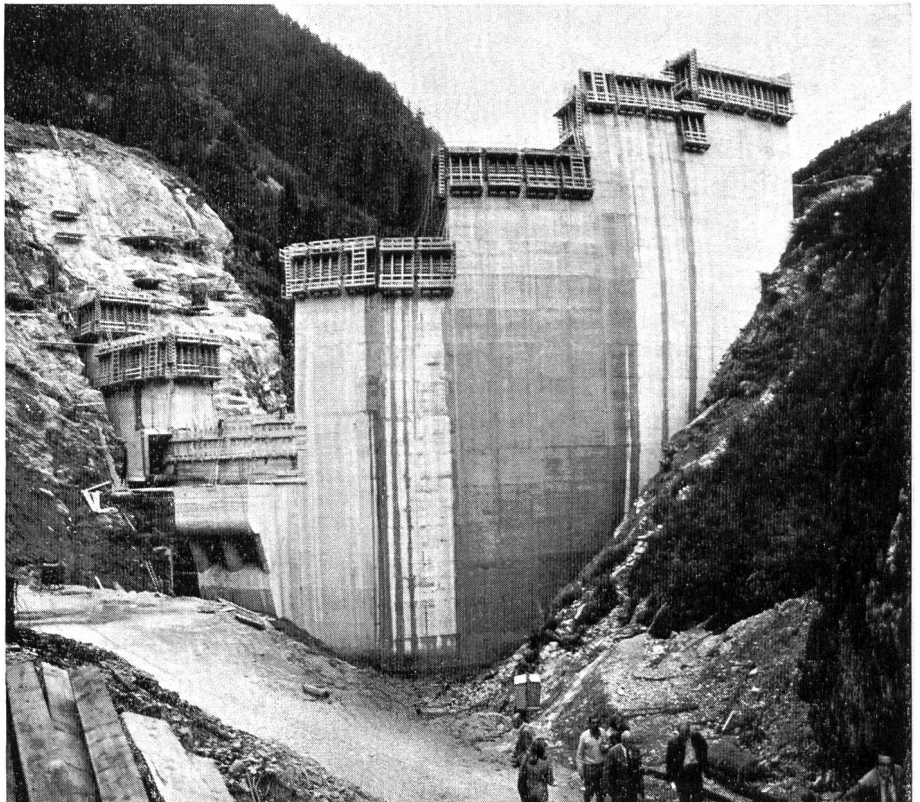
Bild 10 Wasserseitige Sicht der Bogenstaumauer Ferden.

Bildernachweis: Bilder 1, 3/12 C. und G. A. Töndury, Nr. 2 Foto Suter AG.