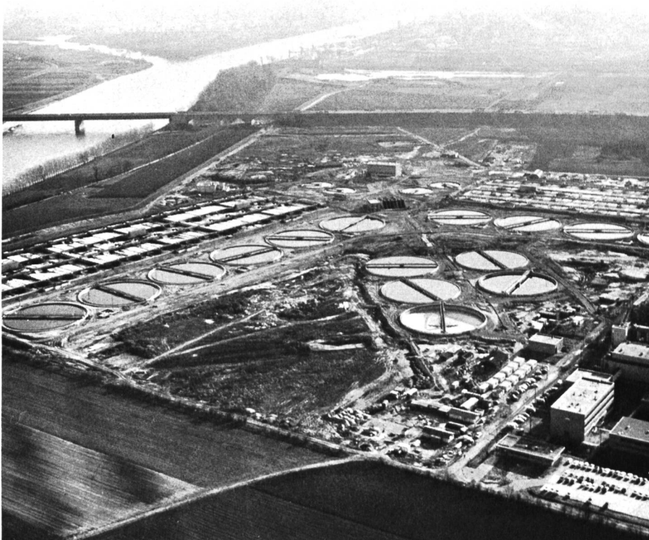
Bild 2 Mechanisch-biologische Gross-Kläranlage der BASF, Ludwigshafen, dimensioniert für 7,2 m 3 /s Trockenwetteranfall (Ausbau 1974/75) und 8,6 m 3 /s (Endausbau).

Die Bundesländer wenden bei ihren Forderungen an die Abwassereinleiter — wie bereits erwähnt — gemeinsame Grundsätze an, nach denen diese verpflichtet werden, verbindliche Emissionswerte als Mindestwerte einzuhalten. Neue Industriebetriebe und Produktionserweiterungen sowie der Bau neuer Siedlungsgebiete dürfen nur dann zugelassen werden, wenn bei der Abwasserreinigung der neueste Stand der Technik berücksichtigt und der angestrebte Gewässerzustand nicht gefährdet wird. Bei bereits bestehenden Anlagen müssen die Anforderungen schrittweise erreicht werden. In Zukunft kommt der Reduzierung der Belastungen durch die chemische Industrie besondere Bedeutung zu. Hier müssen neben dem Bau ausreichend bemessener Kläranlagen auch die notwendigen innerbetrieblichen Massnahmen zur Abwasserreinigung und -verringerung, zum Beispiel durch Eindampfung, durchgeführt werden. Die Produzenten müssen bemüht sein, bereits vor