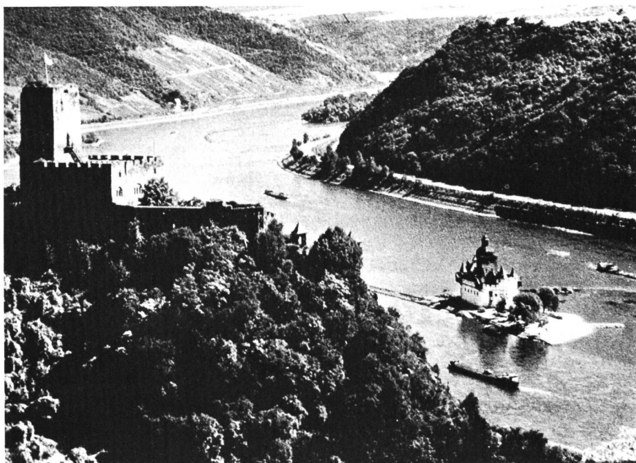
Bild 1 Rhein bei Kaub

Die Ursachen der Gewässerverschmutzung sind sehr vielfältig. Hierbei sind besonders die Abwassereinleitungen aus Kommunen, das heisst Städten und Gemeinden, und aus Industriebetrieben zu nennen. Beim Bau von Anlagen zur Reinigung der kommunalen und industriellen Abwässer bestand im Jahre 1945 ein grosser Nachholbedarf. Erst nach und nach konnte begonnen werden, die erforderlichen Kläranlagen zu planen und zu bauen. Erheblich verstärkt wurde der Kläranlagenbau in der Bundesrepublik seit dem Jahre 1956. Einen Vergleich mit dem Jahr 1970 zeigt die nachstehende Uebersicht der öffentlichen Abwasserreinigungsanlagen im deutschen Rheineinzugsgebiet: