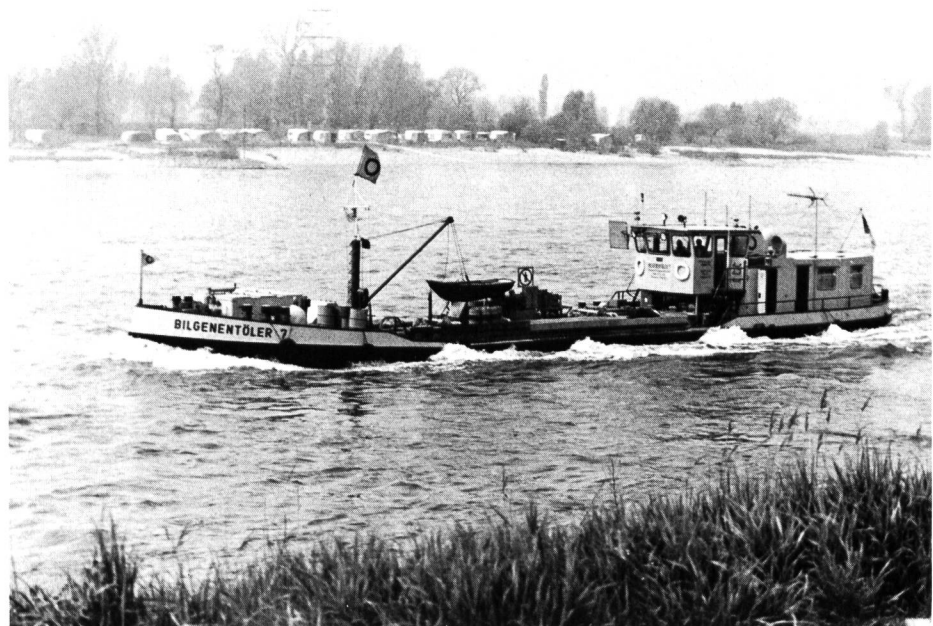
Bild 2 Bilgentöler 7

Um Erfassungs- und Vernichtungsmassnahmen von Bilgenwässern zu koordinieren, stehen wir mit massgebenden