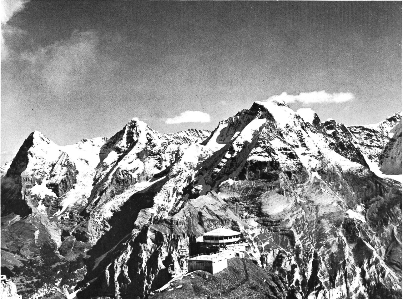
Eiger, Mönch und Jungfrau; vorn das Drehrestaurant auf dem Schilthorn, Ziel der Exkursionsvariante D.