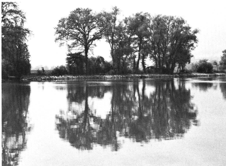
Bild 5 Friedlich-idyllische Landschaft an der Aare.

Die VGL hat versucht, einen engeren Schulterschluss zwischen 20 schweizerischen Verbänden herzustellen, sowohl mit eigentlichen Fachverbänden, die sich seit Jahr-