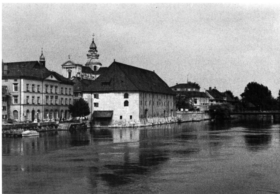
Bild 1 Tagungsort der Jubiläumsversammlung; Landhaus an der Aare in Solothurn. Im Hintergrund Turm der St. Ursuskirche.

Die erste Phase in der Tätigkeit der Vereinigung könnte man als die Zeit der Aufklärung und Motivierung bezeichnen. Es galt, die gesamte Öffentlichkeit zum entschlossenen Kampf gegen die Gewässerverschmutzung aufzurufen. Durch unzählige Vorträge, Publikationen, Berichterstattungen und Veranstaltungen, durch den Aufklärungsfilm ‚Wasser in Gefahr‘ (Condor Film Zürich) und durch das weit über die Landesgrenze hinaus bekannte Erni-Plakat ‚Rettet das Wasser‘ hatte unsere Vereinigung das erste Etappenziel weitgehend erreicht: Das ganze Volk konnte für den Gewässerschutz-Gedanken gewonnen wer-