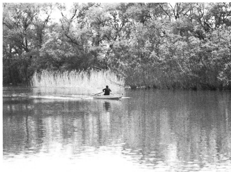
Bild 6 Uferpartie.