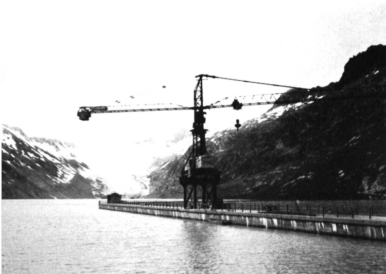
Bild 3 Bauinstallationen auf der Staumauer Oberaar.