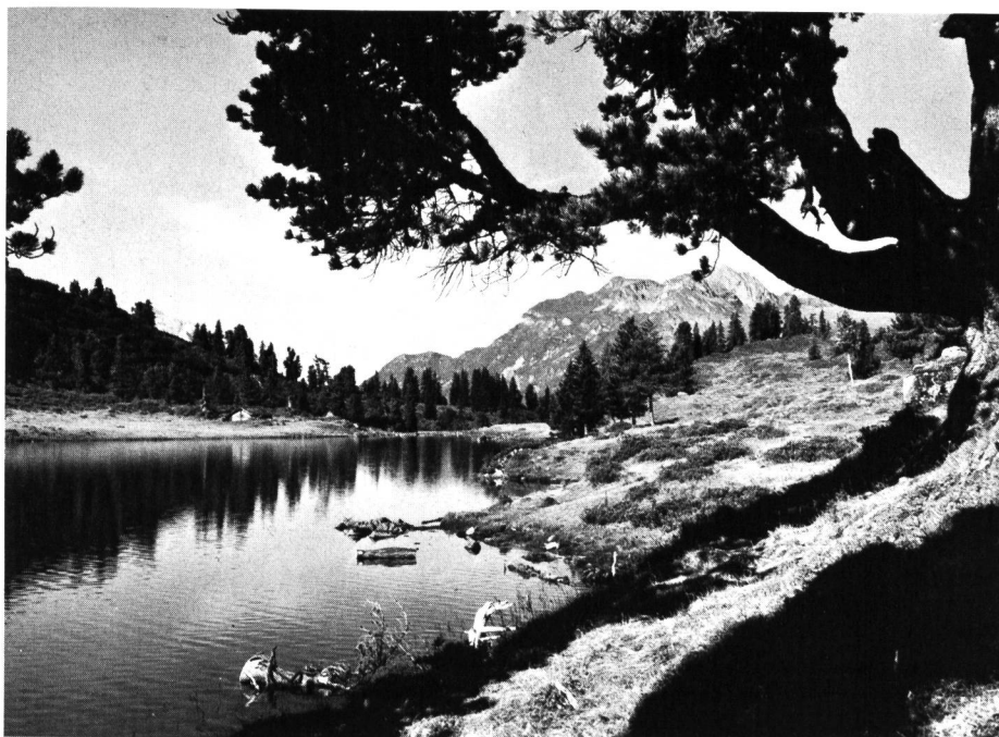
Motiv am Engstlenalpee (Foto R. Würgler/Verkehrsverein Meiringen-Haslital).