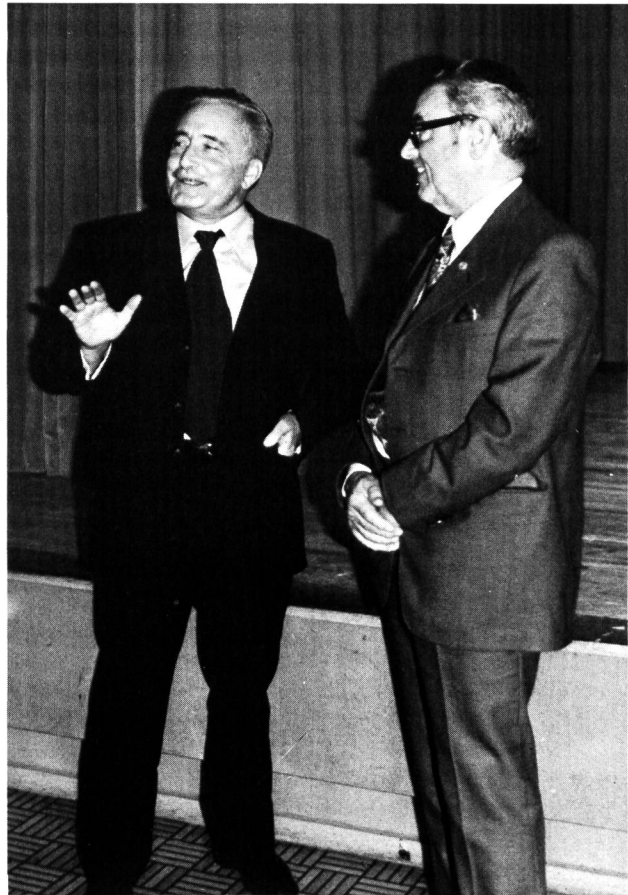
Im Gespräch mit Bundesrat Chevallaz.

Hierauf begeben sich die Tagungsteilnehmer bei strömendem Regen in das nahe Grand Hotel Victoria-Jungfrau,