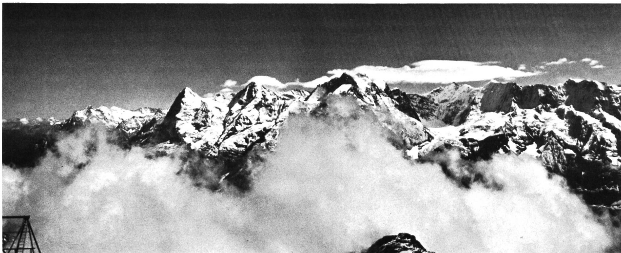
Bild 5 Blick vom 2970 m hohen Schilthorn auf die Berner Alpen; in Bildmitte die markante Gruppe Eiger-Mönch-Jungfrau, rechts Gletscherhorn, Ebnefluh, Mittagshorn und Grosshorn. (Bilder 1/3 und 5: Foto G. A. Töndury).