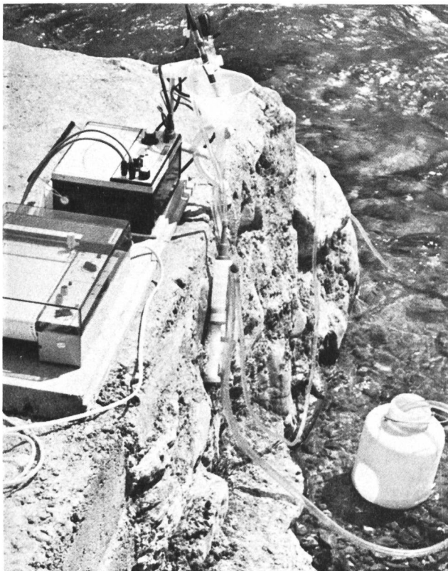
Figure 3. Dispositif de jaugeage composé d'un potentiographe portable et d'un Ion-mètre munis d'une électrode ionique spécifique et d'une électrode de référence. Un équipement de pompage manuelle complète cette installation légère et très mobile sur le terrain. Poids: 6 kg; encombrement: le tout rentre dans un sac à dos.

de saturation, etc.); l'obtention d'un document écrit dont le dépouillement peut être différé; grande rapidité dans les opérations sur le terrain. Poids et encombrement modestes de l'installation.