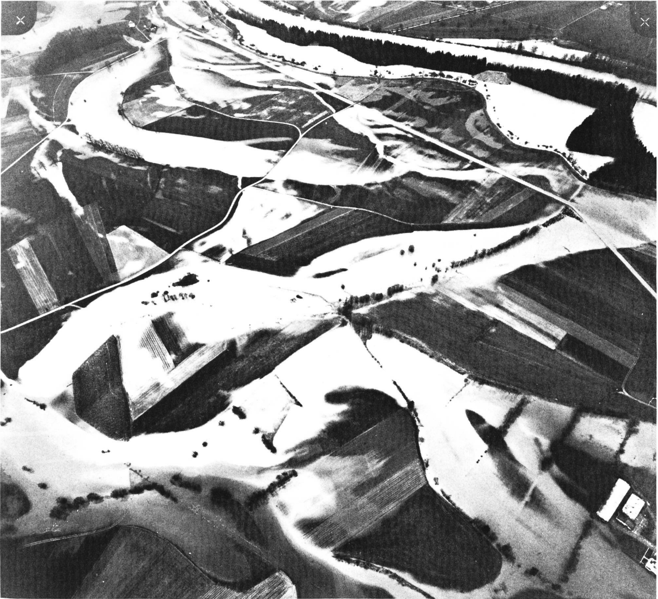
Bild 4. Ueberschwemmungen im Reusstal im November 1972.