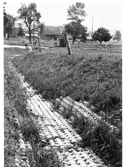
Bild 2, rechts. Schon kurze Zeit nach der Verlegung sind die Steine stark überwachsen.