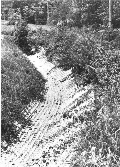
Bild 3. Die UK-Bachverbauung passt sich dem Gelände an.