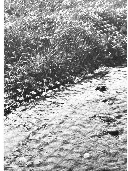
Bild 5. UK-Wasserbausystem: die unsichtbare Armierung des Bodens.

für Kleinorganismen, Pflanzen, Fische und Amphibien gesichert werden. Es erlaubt den natürlichen Austausch zwischen fliessenden Gewässern und dem Grundwasser und verhindert somit das unerwünschte Absinken des Grundwasserspiegels.