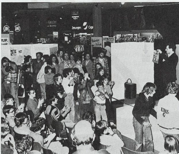
Die Jugend lässt sich für den Umweltschutz noch begeistern (wie hier bei einem Zeichnungs-Wettbewerb).

Auf dem Tätigkeitsgebiet der Aufklärung und Erziehung wurden gemeinsam mit der Aktion Saubere Schweiz, ASS, ebenfalls zwei Arbeitsgruppen ins Leben gerufen. Die Arbeitsgruppe «Schule und Umweltschutzerziehung», in der Fachleute, Graphiker und Gestalter sowie vor allem Lehrer verschiedener Schulstufen mitarbeiten, ist nach eingehenden Vorabklärungen heute daran, Arbeitshilfen und -unterlagen für Lehrer zu entwerfen und auszuarbeiten.