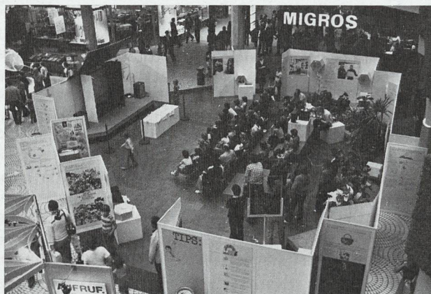
Ein Blick ins stets gut besuchte Filmforum.

Die Umweltschutz-Organisationen stehen vor der undankbaren Aufgabe, der Bevölkerung immer wieder die gleichen Empfehlungen in Erinnerung zu rufen, um ständig weitere Kreise zu motivieren und zur Beachtung wichtiger Massnahmen und Verhaltensregeln zu gewinnen. Zeitungen und Zeitschriften ihrerseits müssen ihren Lesern aktuelle Informationen und Nachrichten vermitteln und sind daher an Wiederholungen gleicher oder ähnlicher Umweltschutz-Informationen nicht besonders interessiert. Für eine optimale Zusammenarbeit mit der Presse musste daher eine neue Form gefunden werden: die Comic-Strips. Die von der VGL und der ASS seit zwei Jahren gemeinsam herausgegebenen Zeichnungsserien fanden ein grosses Echo und werden von einer ständig wachsenden Zahl von Publikationsorganen zum Abdruck übernommen.