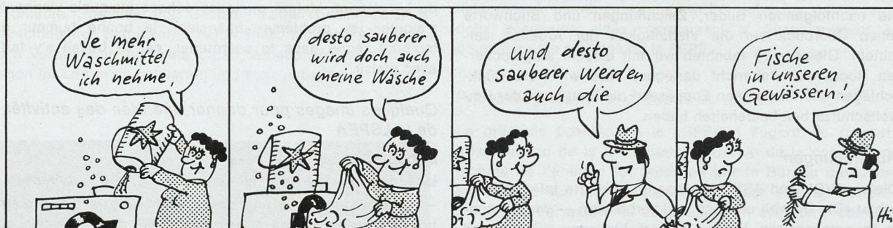
Schweiz. Vereinigung für Gewässerschutz und Lufthygiene Aktion Saubere Schweiz

Les bandes dessinées publiées par la LSPEA et la Ligue pour la propreté en Suisse paraissent depuis deux ans dans un nombre sans cesse croissant d'organes de publication.