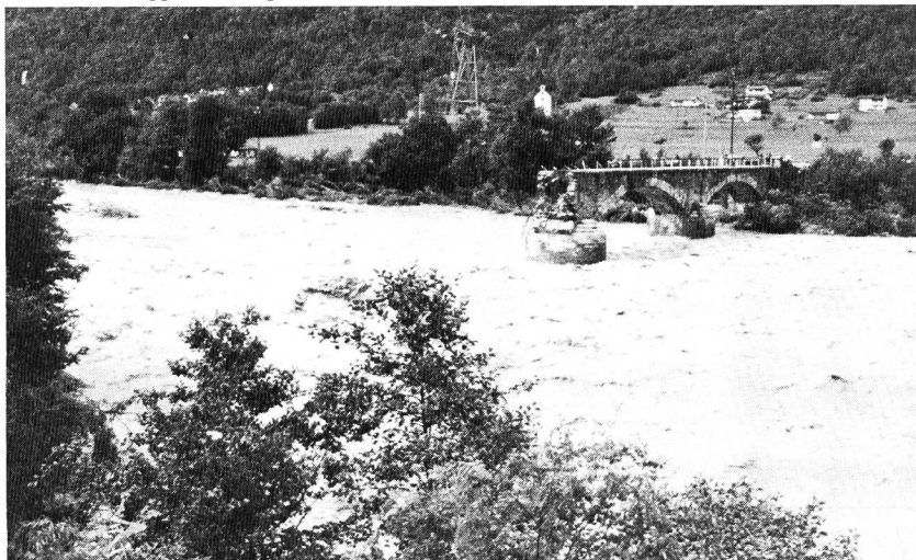
Ponte sulla Maggia ad Aurigeno.