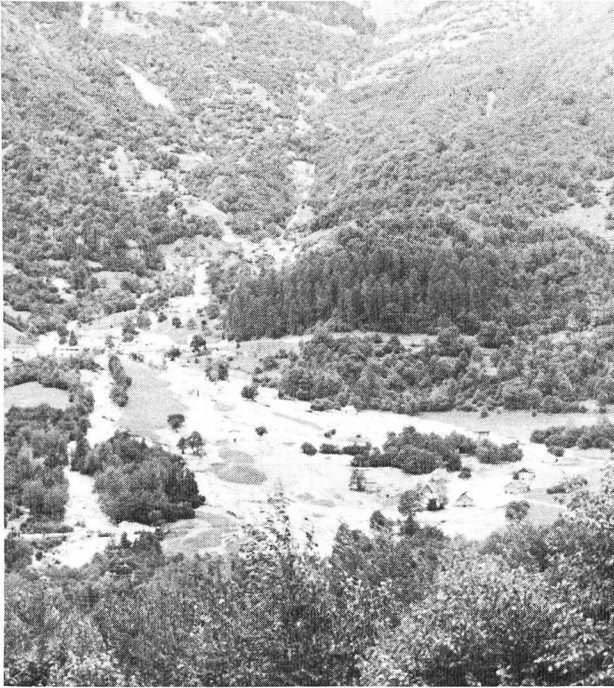
Riale di Marolte (Valle Blenio).