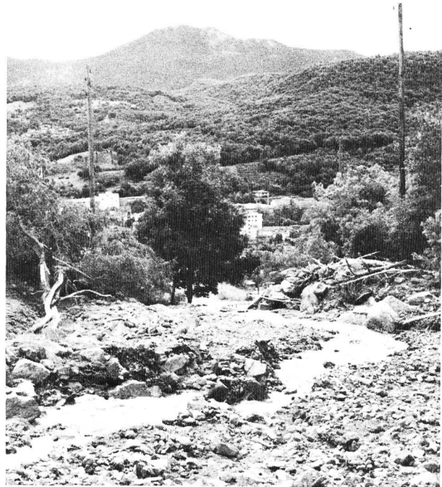
Torricella-Taverne (Val Maggiore).

La piena centenaria, valutata dall'Ufficio federale sulla scorta di lunghi periodi di osservazione ed in base a varie funzioni di probabilità corrisponde a circa 400 m 3 /s. Per la determinazione dei valori massimi defluenti nei vari riali si è ritenuta una portata specifica di 12 m 3 /s è km 2 .