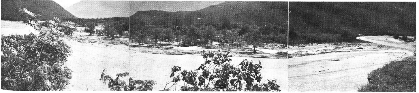
Frana Campo Vallemaggia.

Sono previsti tre modi diversi d'intervento.