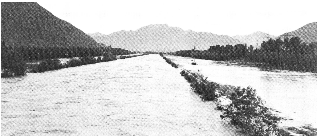
Fiume Ticino a Gudo.

I valori raccolti sull'entità dei deflussi di piena e la loro comparazione con i dati degli eventi alluvionali del 1927—1951—1978 ci hanno permesso di allestire il seguente specchio nel quale la cifra più alta rappresenta la punta registrata o stimata.