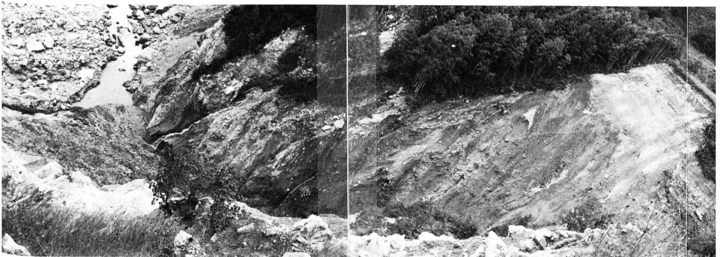
Locarno: zona saleggi.

Per contro si procederà ad un allargamento del letto attuale.