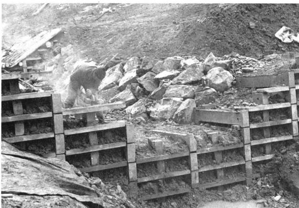
Bild 3. Zwischensperren bis 70 cm Absturzhöhe wurden mit Beton-Fertigelementen gebaut (Krainerwand).

schicht verhindert werden, damit langfristig die Filterwirkung gewährleistet bleibt.