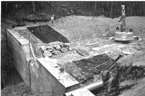
Bild 2. Um das Auffüllmaterial gegen Ausschwemmungen zu sichern, wurde ein Haté-Gewebe eingesetzt.