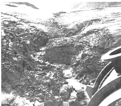
Figure 2, à droite. Lac du Molato (Italie) pendant le nettoyage par la méthode Geolidro. Les boues sont emportées par tuyauterie submergée à un niveau préfixé.