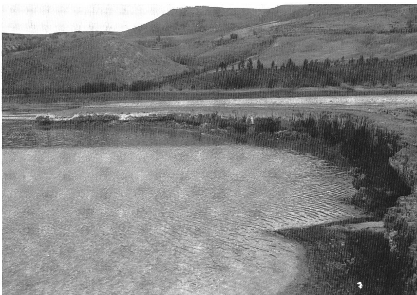
Figure 4. Lac Abate Alonia (Puglia – Italie). Le lac est vide après les travaux de nettoyage. Le front d'excavation, de 8 m d'hauteur environ, sépare la zone nettoyée de celle avec les boues.