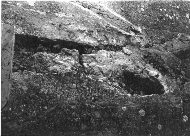
Bild 5. Ein grösserer Schaden an einer Böschungsplatte.

beschädigte Beton ganz entfernt und neu aufgebracht. Dabei wird, wenn notwendig, Armierung eingelegt.