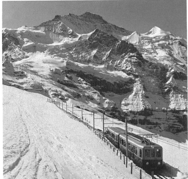
Die Jungfraubahn erschliesst eine einmalige Hochgebirgslandschaft.

Guyer dachte aber noch weiter: Wenn elektrischer Betrieb, dann auch eigene Stromversorgung. Also sicherte er sich in weiser Voraussicht die Wasserrechte an beiden Lütschinen und erhielt am 10. Juni 1896 die Konzession zum Bau der beiden Kraftwerke Lauterbrunnen und Burglauenen respektive Lütschental (früher wurden die Kraftwerke nach dem Ort der Wasserfassung bezeichnet, weshalb das in