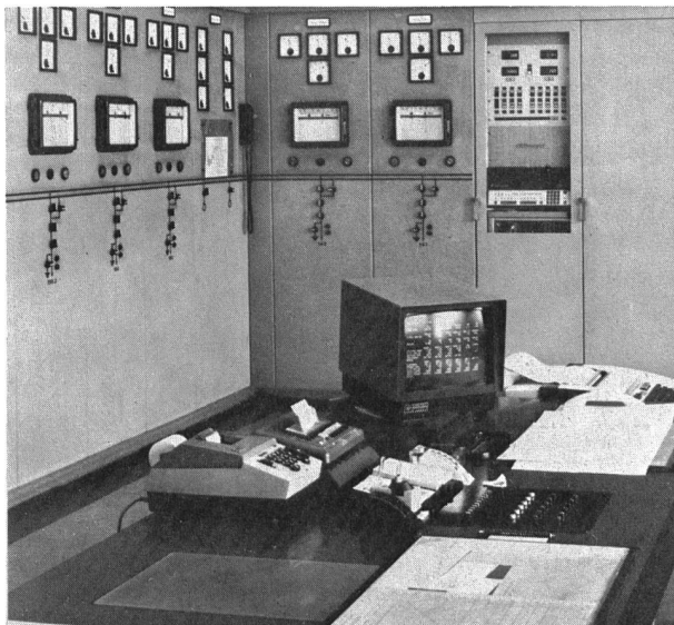
Bild 7. Zentrale Neuötting.

raum in Anspruch, da mehrere Betriebsarten (Wehr- und Turbinenbetrieb mit verschiedener Turbinenanzahl) und weite Bereiche der Wasserführung (100 m 3 /s bis 2000 m 3 /s) beherrscht werden müssen. Ein Kompromiss zwischen Regelgüte, Stabilität und Häufigkeit der Stellbefehle muss bei jeder Anlage empirisch gefunden werden.