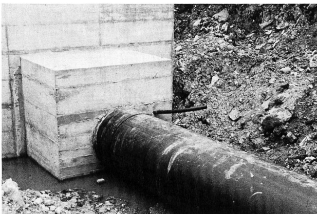
Bild 5. Der Fixpunkt am Turbinenhaus.

Querschnittes. Vor Inangriffnahme der Eindeckarbeiten wurde die Leitung einer Druckprobe unterzogen. Die dabei benötigte Wassermenge beträgt etwa 600 m 3 .