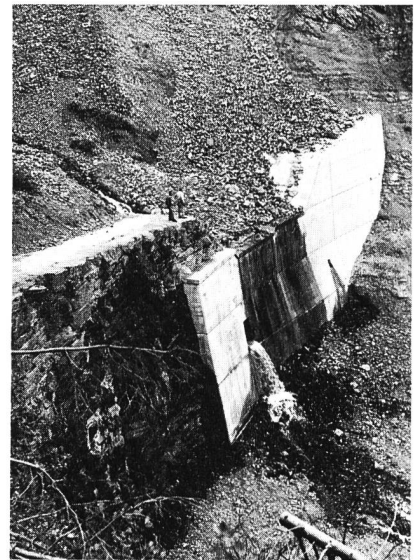
Bild 3, rechts. Die mit einer Betonvormauer jüngst sanierte Sperre 4a. 900 000 Franken kostete diese Verstärkung, die auch mit den heutigen technischen Möglichkeiten hohe Ansprüche an die Baukunst stellt. Aber schon ist der Berg wieder in Bewegung; die rutschigen Geröllhalden lassen den Menschen nicht ruhen. Und wer traut jetzt diesem harmlosen Rinnsal zu, dass es nach einem Unwetter zum alles bedrohenden Wildbach wird.

fünf Wildbäche, die in der Gegend von Brienz und Kienholz in den Brienzensee münden (Bild 1). Seit jeher gefährden sie diese Dörfer. Als besonders unberechenbar unter ihnen gilt die Lamm, deren Kontrolle heute auf dem Programm steht.