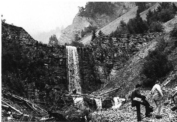
Bild 1. Die alten Lammbachsperrren sind ein wahres Meisterwerk des Tiefbaus, mit einfachsten Mitteln unter schwierigsten Bedingungen gebaut. Sie müssen laufend überwacht werden und brauchen ständigen Unterhalt, wenn sie ihre wichtige Aufgabe zuverlässig erfüllen sollen.

Überall auf der Welt, wo die Zivilisation einmal Fuss fasste, geschah und geschieht Ähnliches auch heute noch. Je nach Gegend reagiert die Natur auf menschliche Eingriffe in ihren Haushalt verschieden. Im Emmental nahm ihre Reaktion dramatische Formen an: