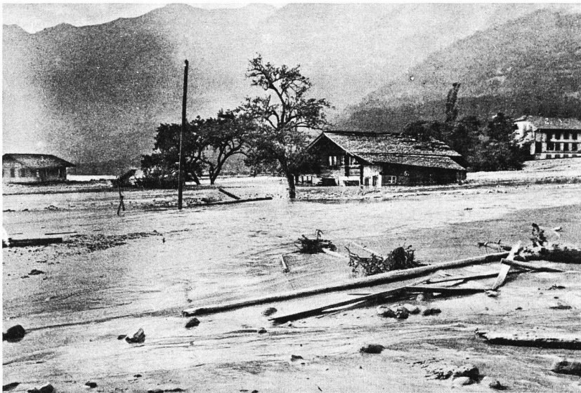
Bild 2, links. Schwere Schäden richtete die Überschwemmung des Lambbaches im Jahre 1896 an, als der unverbaute Bach innert kürzester Zeit 300 000 m 3 Geröll und Erde mit sich riss. Häuser versanken meterhoch im Schlamm und wurden gar aus ihren Fundamenten gerissen, die Strasse und die Geleise der Brünigbahn wurden unterbrochen.