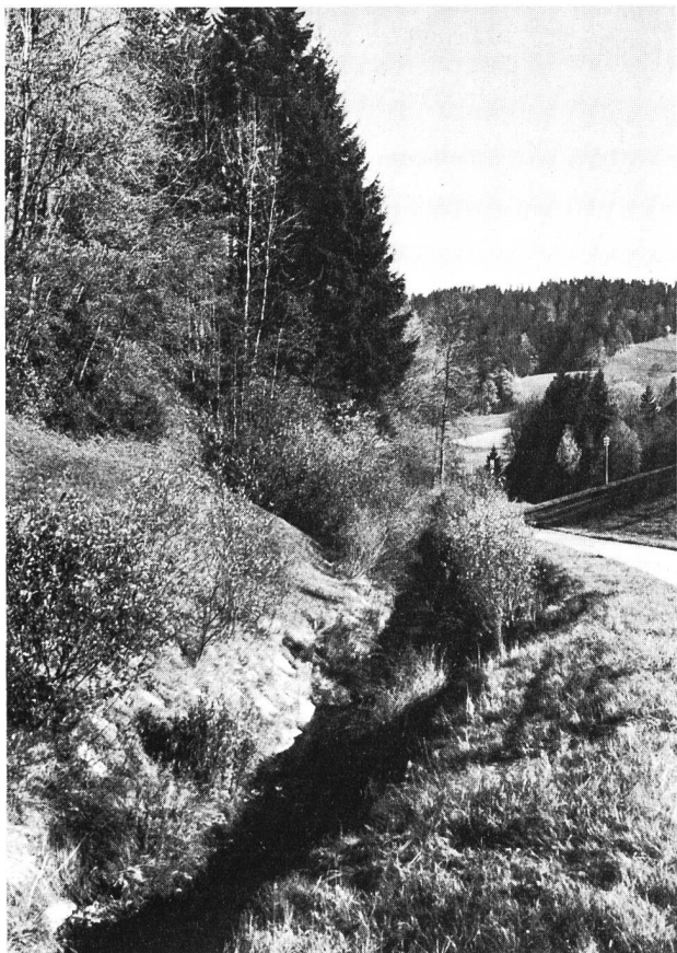
Figura 1. È inevitabile che dei corsi d'acqua vengano toccati da vie di comunicazione e debbano essere corretti. In questi casi bisogna tendere ad una sistemazione al più possibile conforme alla natura del profilo trasversale e del tracciato; si raccomanda inoltre di piantare una siepe di separazione.

Essa si rivolge a tutti gli interessati, in primo luogo ai progettisti, agli uffici competenti ed alle istanze cui spetta il preavviso in materia.