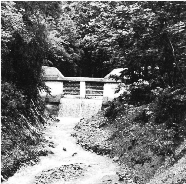
Figura 3. Sbarramento aperto con montante intermedio e travi orizzontali. Colata di fango presso Trimmis, Cantone Grigioni.

zone larghe, calme dove il pesce trova un ambiente a lui congeniale.