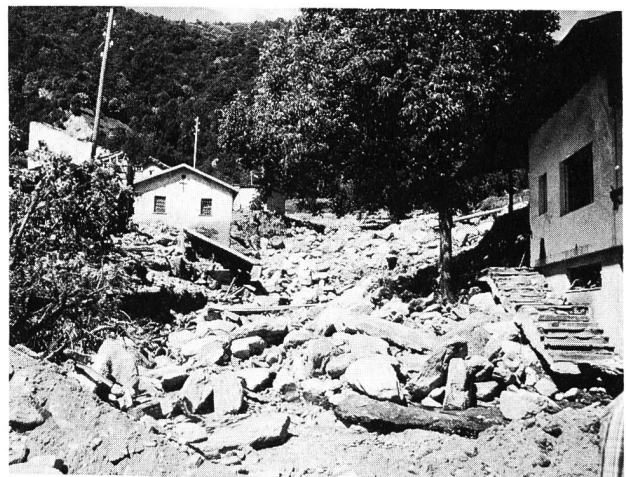
Figura 2. Torrente straripato nell'anno 1978, Valle di Blenio presso Marolta, Cantone Ticino.

– Un profilo di deflusso il più possibilmente variato non solo è importante per i pesci, ma consente pure una diversificazione agli altri organismi che vi soggiornano: tratti di corsi d'acqua a deflusso rapido dovrebbero alternarsi a