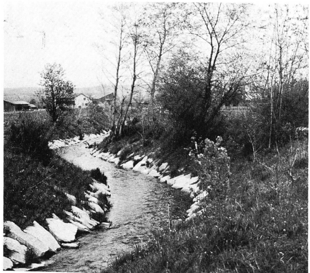
Figura 4. Lavori di correzione del ruscello Uerke presso Kölliken, Cantone Argovia (profilo trasverso = 30 m 3 /s).

I costi relativi ad un miglioramento che la correzione apporta allo stato primitivo saranno da ripartire in base ai vantaggi che risultano per i vari interessati.