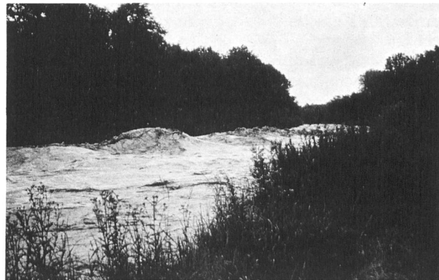
Bild 2. Das Flussbett der Emme oberhalb der Brücke Utzensdorf/Bätterkinden; Hochwasser vom 10.7.1977.

Il est fréquent que le débit de crue doive être estimé, car on ne dispose pas de mesures directes. On recourt alors à différentes méthodes, modèles, voire formules empiriques en faisant appel à des données enregistrées en un autre point