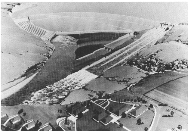
Bild 2. Projektansicht des Wasserkraftwerks «Atatürk». Die installierte Leistung wird 8 × 300 MW betragen, die jährliche Stromproduktion rund 8 Mrd. kWh. BBC Brown Boveri und Sulzer-Escher Wyss werden die gesamte elektrische und hydraulische Ausrüstung liefern.

Beim Kraftwerk «Atatürk» handelt es sich nach Keban und Karakaya um die dritte und grösste Staustufe am Euphrat. Das Bauwerk ermöglicht gleichzeitig die Bewässerung von über 8000 km 2 Land. Die Türkei betrachtet die Realisierung dieses Vorhabens seit langem als eine sehr bedeutende nationale Aufgabe.