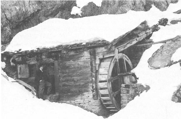
Bild 1: Dieses oberflächliche Wasserrad aus Töbel im Vispental VS trieb eine Hammerwalke für Textilgewebe an. Das Technorama der Schweiz rettete dieses Rad mit Walke 1959 vor der Zerstörung. Konserviert wartet es auf einen Einsatz in der Ausstellung. Die Erhaltung von Wasserrädern löst hohe Kosten aus. Ein Inventar vorhandener Wasserräder, in Vorbereitung durch das Technorama der Schweiz, erleichtert den sinnvollen Einsatz der Mittel von Denkmalpflege und Museen.

Energie ist ein wichtiges Thema im Aufgabenkreis des Technorama der Schweiz in Winterthur. Wasserräder sind beinahe zum Symbol für die Frühzeit der Energieumwandlung geworden. Im Zusammenhang mit Abklärungen betreffend der Übernahme des zurzeit stärksten Wasserrades der Schweiz durch das Technorama Winterthur hat sich gezeigt, dass eine Übersicht über noch vorhandene Wasserräder fehlt. Eine solche Übersicht wäre für einen gezielten Ein-