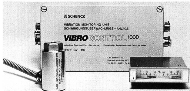
Die Schwingungsüberwachungsanlage Vibrocontrol 1000.

Neben hoher Leistungsfähigkeit wird bei Vibrocontrol 2000 besonderer Wert auf Betriebssicherheit gelegt. Zur Vermeidung von Fehlalarmen ist das System mit umfangreichen Schutzschaltungen ausgestattet, die selbsttätig Störungen in den Schwingungsaufnehmern und der Versorgungsspannung erkennen und melden. Einmalig ist