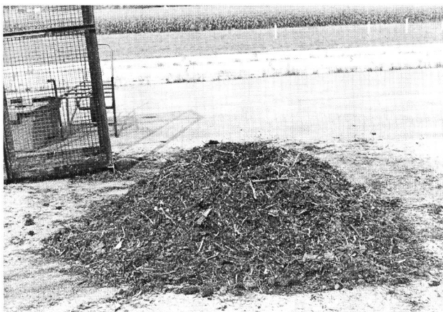
Bild 4. Garten- und Küchenabfallkompost nach 6monatigem Rotteversuch.