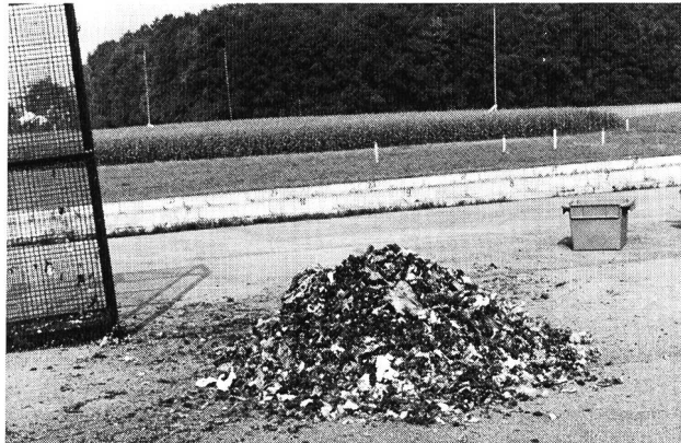
Bild 3. Siedlungsabfallkompost nach 6monatigem Rotteversuch.