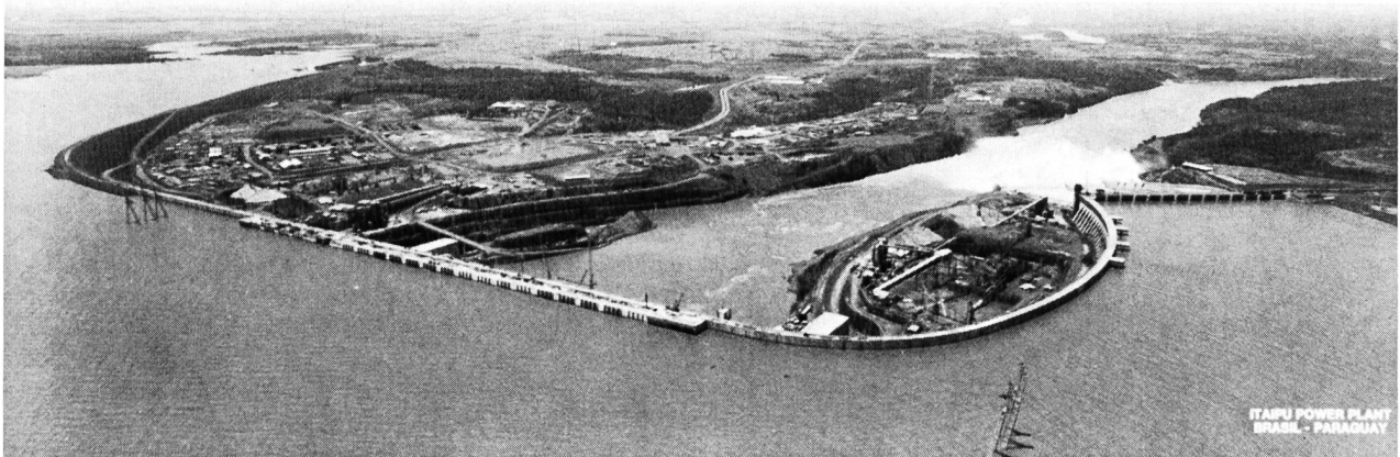
Bild 1. Nach seinem Vollausbau wird Itaipu an der Grenze zwischen Brasilien und Paraguay das grösste Wasserkraftwerk – und Kraftwerk überhaupt – der Welt sein. Die 12 600 MW Leistung (derzeit 4900) kommen aus 18 riesigen Turbogeneratoren. Der Staudamm im Rio Parana ist bereits seit 1982 fertiggestellt: Auf den Seitenabschnitten seiner insgesamt 7,9 km Länge ist er ein Erddamm mit Felskernschüttung, beim Krafthaus – Bildmitte – eine 196 m hohe Beton-Gewichtsmauer.

Die zuverlässigste Übersicht dürfte jene der englischen Fachzeitschrift «Water Power and Dam Construction» (Wasserkraft und Dammbau) vom Juli 1986 sein. Danach steht hinsichtlich Dammhöhe, gemessen vom tiefsten Punkt des Fundaments bis zur Krone, der Erd- und Steinschüttdamm des Speicherkraftwerks Rogun in Tadschikistan, UdSSR, mit 335 m an der Spitze, gefolgt von dem 300 m hohen reinen Erddamm des Kraftwerks Nurek, ebenfalls in Tadschikistan; Nurek arbeitet seit 1980, Rogun wird erst 1987 fertig. Dritter in dieser Rangliste ist die 1962 vollendete Beton-Gewichtsstaumauer Grande Dixence in der Schweiz mit 285 m Höhe. Gleich dahinter kommen die höchsten Beton-Bogenstaumauern, nämlich Inguri (1980) in Georgien, UdSSR, mit 272 m und Vajont (1961), Italien, mit 262 m. An 13. Stelle scheint die 237 m hohe Bogenstaumauer von Mauvoisin (1975) in der Schweiz auf, und den 20. Platz teilen sich die Bogenstaumauern von Contra (1965), Schweiz, Dabaklamm (Fertigstellung 1989), Österreich, und Mratinje (1976), Jugoslawien, mit je 220 m. Ausser den genannten sechs befinden sich unter den 25 höchsten Dämmen, deren niedrigster immerhin noch 215 m misst, keine weiteren europäischen, dagegen ebenfalls sechs in der UdSSR, vier in den USA und drei in Indien.