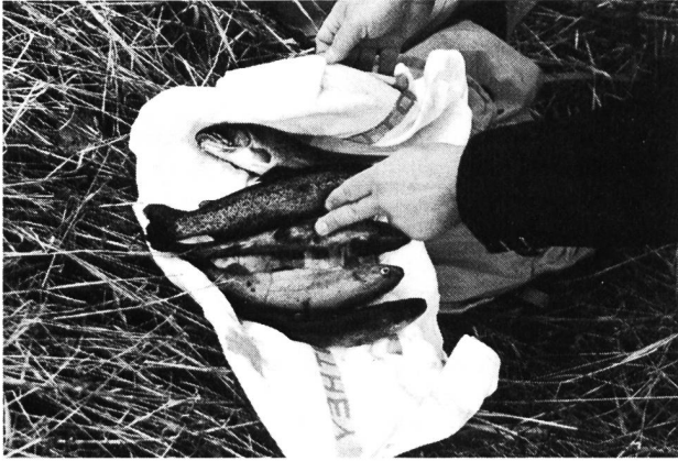
Bild 3. Ein gelungener Fang.

Jahreszeit nicht der Fall ist. Während heute der Fischbestand aus den genannten Gründen zur optimalen Nutzung des reichen Futterangebotes während der Wachstumsperiode nicht ausreicht, dürfte sich künftig ein umgekehrtes Missverhältnis zwischen Lebensraum und verfügbarer Nahrung einstellen.