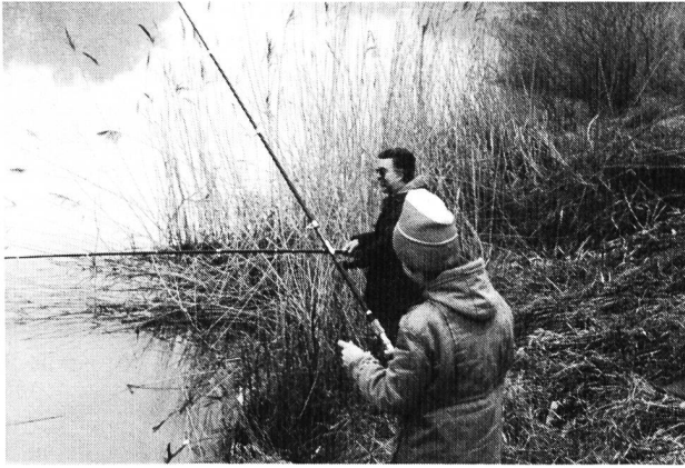
Bild 2. Schilfbestände im Stausee Evionnaz des bestehenden Kraftwerks Lavey.

Aufgrund der bereits heute voraussagbaren abiotischen Umweltbedingungen wird die Rhone schlechtestenfalls (unterste Stauhaltungen) in den Grenzbereich der Forellen-/Äschenregion abgleiten. Die Herkunft allenfalls auf-tretender karpfenartiger Fische wird sich wegen der erschweren Aufstiegsbedingungen in der Rhone selber auf das Kanalsystem beschränken, das mit der betreffenden Stauhaltung in offener Verbindung steht.