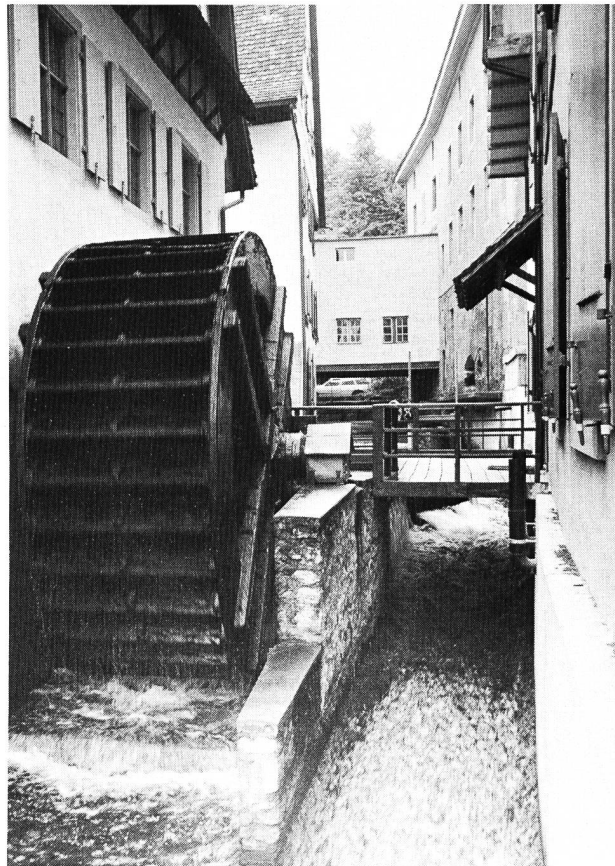
Sogenannter Hinterer Teich, ein Arm des St.-Alban-Teichs, mit unterschlächtigem, hölzernem Wasserrad (4,70 m Durchmesser, 36 Schaufeln). Es treibt ein Stampfwerk im Schweizerischen Papiermuseum an.

Aus dem St.-Alban-Teich wurde auch Bewässerungswasser in die angrenzenden, landwirtschaftlich genutzten Flächen abgegeben. In den Ebenen entlang der Birs bestanden die Verteilbauwerke aus