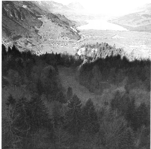
Bild 1. Aufnahme Beckenstandort Tobelplatz vom 16. Januar 1988.

Die durch die Wasserableitung betroffenen Gewässer gehören in die Kategorie der karbonatreichen subalpinen Gebirgsbäche. Sie sind charakterisiert durch ein hohes Gefälle, ihren Geschiebereichtum, die instabile Sohle, ein kaskadenartiges und entsprechend vielgestaltiges Längsprofil sowie durch einen aufgrund des verhältnismässig geradlinigen Verlaufs eher symmetrischen Abflussquer-