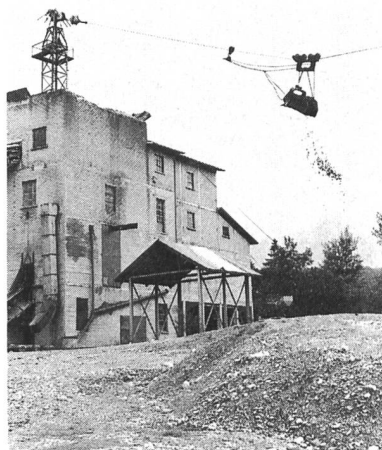
Kies ist unser wichtigster Bodenschatz – doch die nutzbaren Schotterfluren sind bald abgebaut, und was die Flüsse an frischem Gesteinsmaterial herantragen, deckt nur einen geringen Teil des Bedarfs.

Im Quartär, dem jüngsten Zeitabschnitt der Erdgeschichte, hat die Schweiz mehrere Eiszeiten erlebt. Gletscher aus den Alpen stiessen weit ins Mittelland vor und brachten riesige Mengen an Gesteinsmaterial mit. Schmelzwasserströme beförderten diese Alpensteine weiter, rundeten sie zu Geröllern und lagerten sie schliesslich als Schotter ab. Der Nut-