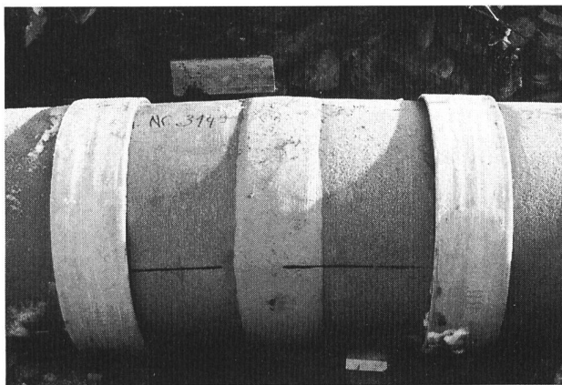
Bild 4. Rohrkrümmer in der 700-mm-GUP-Leitung, bestehend aus einem Krümmerteil, der aus zwei Rohrabschnitten in der Werkstatt zusammengeschweisst und mit einem Wulst verstärkt wurde. Links und rechts ist der Krümmer mit Spezialmuffen ans Rohr angeschlossen.

700 mm zu reduzieren, ohne zusätzliche Energieverluste in Kauf nehmen zu müssen.