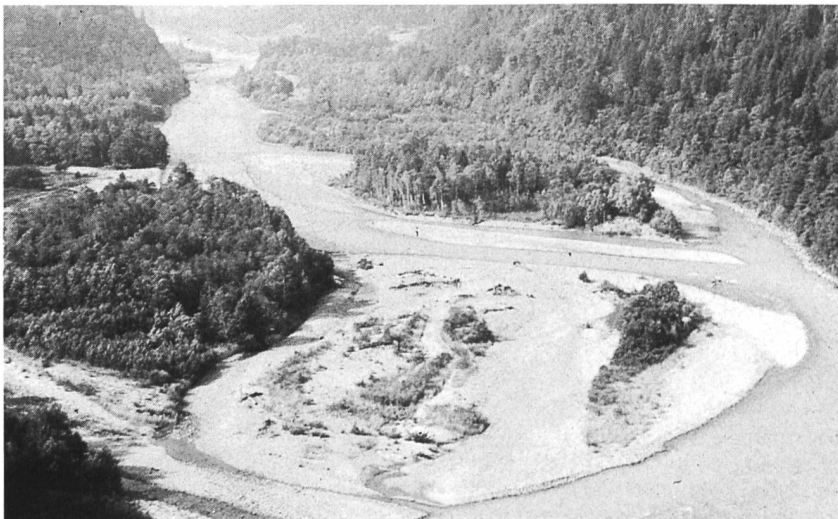
Bild 4, rechts. Die Maggia bei Somoio ist einer der wenigen ungezähmten Schweizer Flüsse.