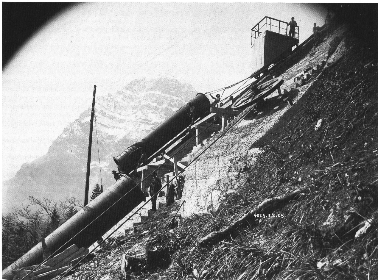
Bild 3. Die Baustelle für die Druckleitung des Löntschwerks am 1.5.1908.

Der Gründungsvertrag bestimmt, dass die NOK in der Form der Aktiengesellschaft nach kaufmännischen Grundsätzen, unter Berücksichtigung angemessener Verzinsung und Abschreibung, zu führen sind. Die Aktien dürfen nicht an Dritte, sondern nur an eigene staatliche Elektrizitätswerke veräussert werden. Als Aktiengesellschaft in öffentlicher Hand stehen für die NOK nicht das Profitstreben und eine Gewinnmaximierung im Vordergrund. Es wird vielmehr eine Dividendenausschüttung angestrebt, welche den Aktionären eine angemessene Verzinsung des eingebrachten Aktienkapitals gewährleistet. Mit der bewährten Rechtsform der Aktiengesellschaft wird den NOK der erforderliche Handlungsspielraum eingeräumt, um sich im wirtschaftlichen Wettbewerb erfolgreich zu behaupten. Dies mit der Konsequenz, dass die NOK die benötigten Mittel ohne irgendwelche staatliche Zuschüsse selbst zu erwirtschaften haben. Für Verpflichtungen gegenüber Gesellschaftsgläubigern haftet allein das Gesellschaftsvermögen – eine subsidiäre Staatshaftung besteht nicht. Konform zum Aktienrecht entscheiden über Investitionen oder Beteiligun-