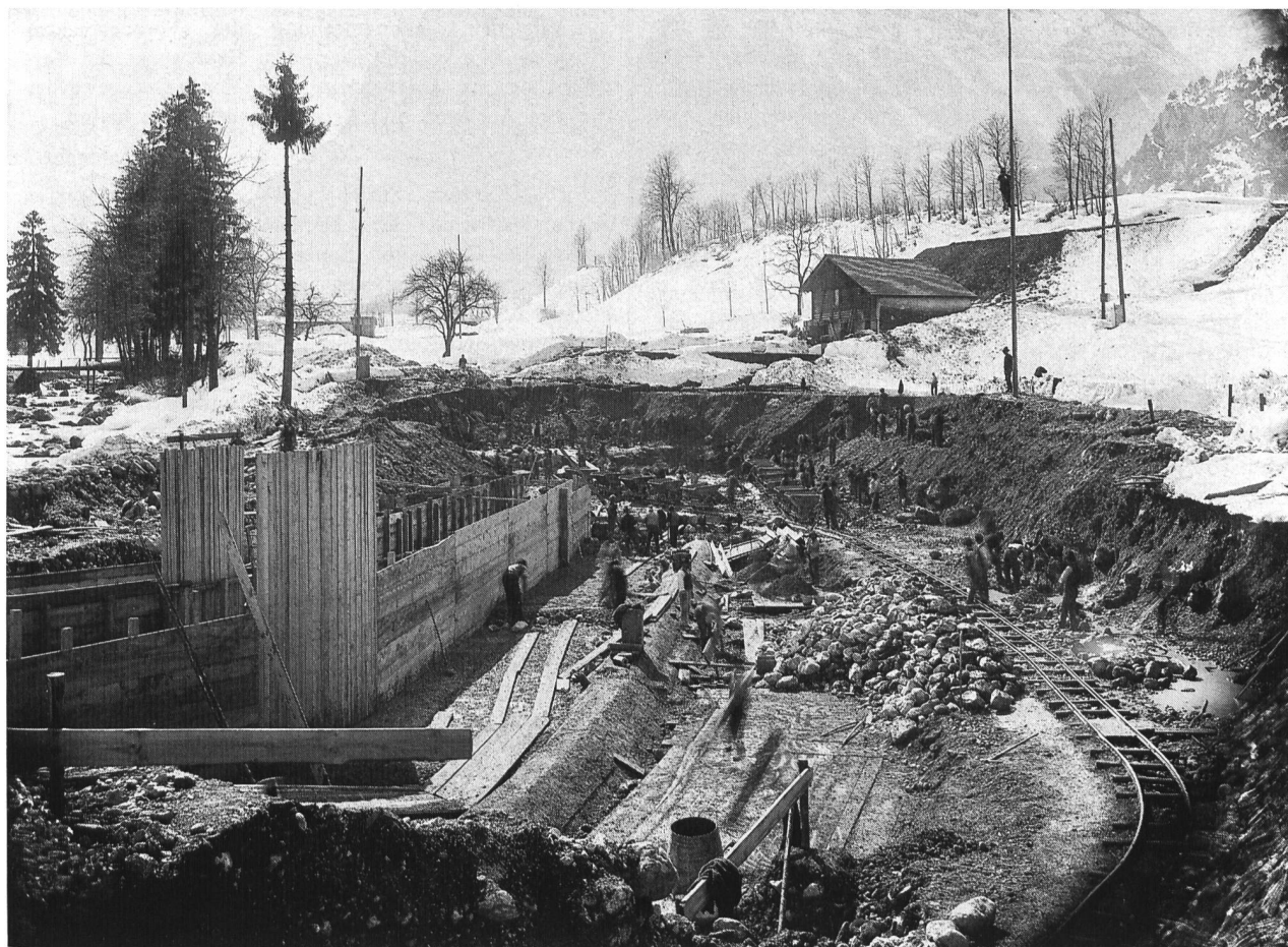
Bild 1. Die Aushubarbeiten für die Zentrale des Kraftwerks Löntsch, 1907.

Die Gründer gingen behutsam ans Werk. Sie veranstalteten keine herzlose Verstaatlichung, sie zerstörten die beste-