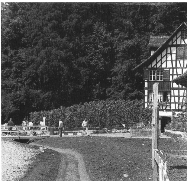
Bild 3. Beim Bau des Museumsbaches Ballenberg.

Im Zuge des Bachbaues wurde auch die Umgebung der Baugruppe östliches Mittelland teilweise neu gestaltet. Zahlreiche Bäume und Büsche wie auch eine Reihe von Kopfweiden säumen bald die Uferböschung, und Obstbäume mit alten, längst vergessenen Sorten vervollständigen die dorfähnliche Anlage.