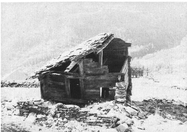
Bild 2. In manchen Bergtälern zerfallen die nicht mehr genutzten Almhütten. Ist mehr als die Hälfte des Daches eingestürzt, gilt das Gebäude als Ruine – und wird mit entsprechender Signatur auf der aktualisierten Landeskarte eingetragen.

Wie gut wir es in dieser Hinsicht haben, zeigt sich gerade in Grenzgebieten wie der Simplonregion. Wer jenseits der Grenze auf italienische 25000er-Blätter wechseln möchte, findet – mühsam genug – nur einfarbige Karten aus den Jahren 1925 bis 1935, aufgenommen nicht etwa von Ver-