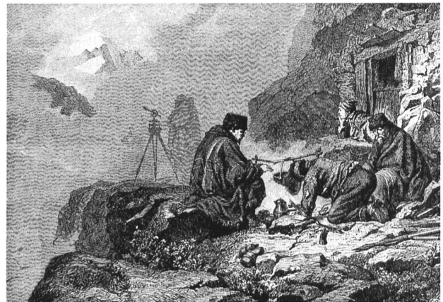
Bild 1. Ohne Mühen keine genauen Karten, einst wie heute: Dieser Holzstich aus der Zeit um 1860 heisst «Topographen im Gebirge».