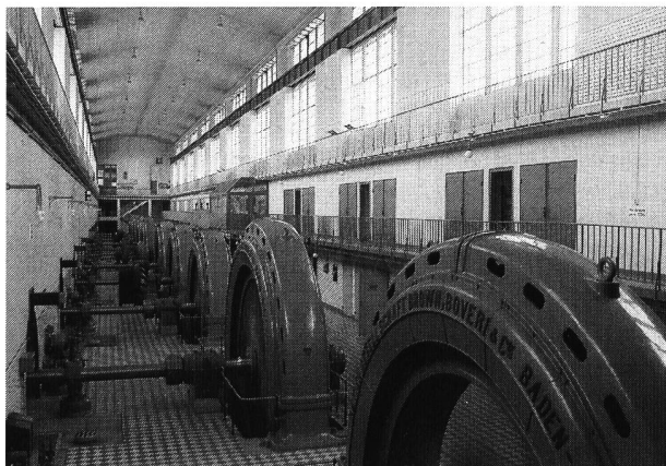
Bild 1. Blick in die Generatorhalle des 1908 bis 1912 erbauten Rheinkraftwerkes Augst, für das Umbauprojekte vorgelegt wurden.

Das Doppelkraftwerk Augst-Wyhlen ist ein typisches Niederdruck-Flusskraftwerk am Hochrhein. Es liegt zirka 8 km unterhalb des Kraftwerkes Rheinfelden und 7,4 km oberhalb des Kraftwerkes Birsfelden. Das Kraftwerk Augst auf Schweizer Seite wird durch die Kraftwerk Augst AG betrieben. Die Aktiengesellschaft mit Sitz in Augst gehört anteilmässig zu 40% dem Kanton Aargau, zu 20% dem Kanton Basellandschaft und zu 40% dem Aargauischen Elektrizitätswerk, AEW, welches auch für die Geschäftsleitung zuständig ist. Entsprechend den Anteilen wird die erzeugte Energie in die Kantone Aargau und Basellandschaft geliefert. (KWA, 5. Juni 1989)