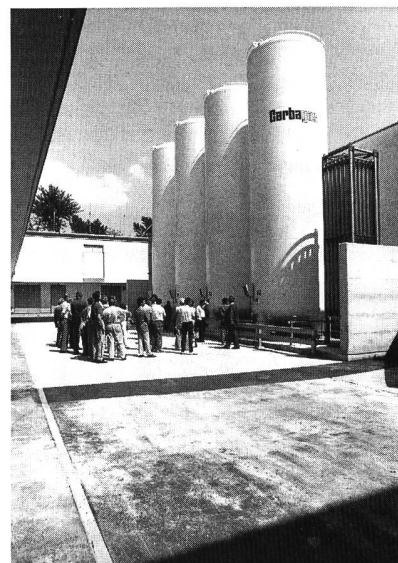
Bild 2. Lagertanks für flüssigen Sauerstoff.