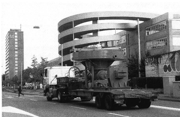
Bild 1. Die 5 t schwere Tasster-Anlage wird auf einem Spezialtransporter nach Thalwil überführt.

In der Region Zimmerberg fällt zuviel Klärschlamm an, so dass dieser nicht vollumfänglich landwirtschaftlich verwendet werden kann. Die jahreszeitlichen Bedarfsschwankungen für Klärschlamm als Flüssigdünger in der Landwirtschaft erfordern Speicherkapazitäten. Bei strikter Beachtung ökologischer Erfordernisse werden diese noch wesentlich ansteigen. Dank dem Einsatz einer Schlamm-entsorgungsanlage, die durch Komprimierung den Klärschlamm auf 1/5 seines ursprünglichen Volumens reduziert, konnte innerhalb weniger als einem Jahr für mehrere Zürcher Gemeinden eine zukunftsweisende und kostengünstige Lösung gefunden werden.