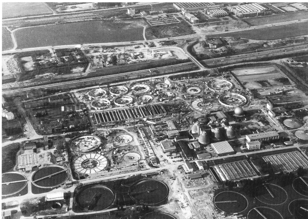
Bild 1. Blick auf die im Bau befindliche 2. Stufe des Klärwerks München I, Biologische Reinigungsanlage (Mitte), die Bundesautobahn München-Nürnberg und die Hilfsbrücke darüber zur Baustelleneinrichtung (Freigegeben Reg. v. Obb. G4/M10516C).

Die Erweiterung um eine zweite biologische Reinigungsstufe umfasst im wesentlichen den Neubau von acht rechteckigen Belebungsbecken (45 x 24 m) und sechzehn Rundbecken mit 43 m bzw. 61,50 m Aussendurchmesser zur Nachklärung in zwei Stufen, ein Maschinenhaus und