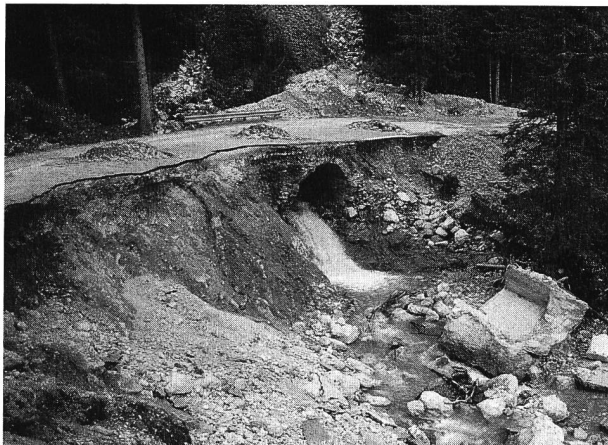
Bild 1. Strassendurchlässe sind für Hochwasserabflüsse oft zu knapp bemessen, so dass überströmendes Wasser zu Erosionsschäden führt.

Überschwemmungen gibt es zwar auch heute immer wieder; gegenüber früheren Jahrhunderten haben sie aber dank Gewässerkorrekturen und Schutzbauten in der Regel nicht mehr diese überregionalen, verheerenden Auswirkungen auf die nackte Existenz. Etwas salopp gesagt: Angesichts unserer extrem hoch entwickelten, gleichzeitig aber auch äusserst verwundbar gewordenen Zivilisation sowie der bedeutend dichteren Besiedlung könnten wir uns Hochwasser und Überschwemmungen im Ausmass früherer Jahrhunderte gar nicht mehr «leisten» – auch nicht finanziell. Gleichzeitig scheint uns aber auch der gesunde Menschenverstand für ursächliche Zusammenhänge abhanden gekommen zu sein: Einerseits fordern wir grösstmögliche «Sicherheit» in allen Lebenslagen – auch Sicherheit vor nassen Füßen – andererseits eine «intakte Natur» mit «frei fliessenden Gewässern».