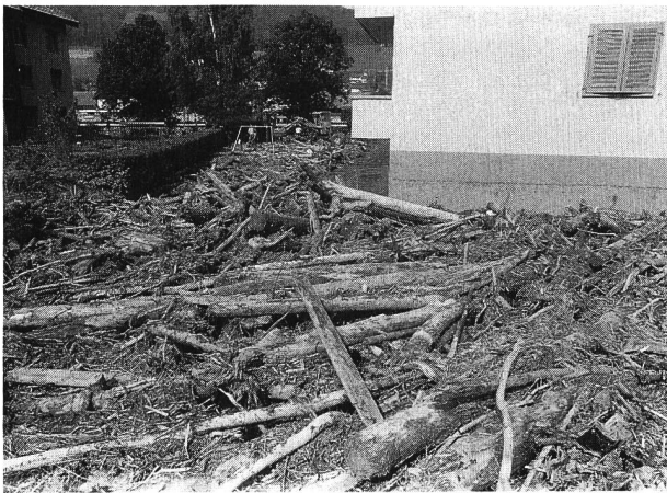
Bild 2. Hochwasser verursachen nicht nur Schäden infolge Überflutungen, sondern auch durch Geschiebe- und Wildholzablagerungen.

Da hatten unsere Vorfahren wohl oder übel noch ein nüchterneres Verhältnis zur Natur: Denn diese Natur, mit der man leben musste, war häufig genug – gerade was die Gewässer betraf – auch ein Feind. Und so, wie die Menschen an den flachen Meeresküsten damit begannen, ihre Siedlungen und Kulturen mit Deichen vor den Meeresfluten zu schützen, wies man hierzulande angesichts einer stark wachsenden Bevölkerung und des parallel dazu wachsenden Bedarfs an Acker- und Weideland unberechenbare Bach- und Flussläufe allmählich in die Schranken, verbaute Wildbäche und regulierte schliesslich auch grösstenteils die Abflüsse aus den Seen.