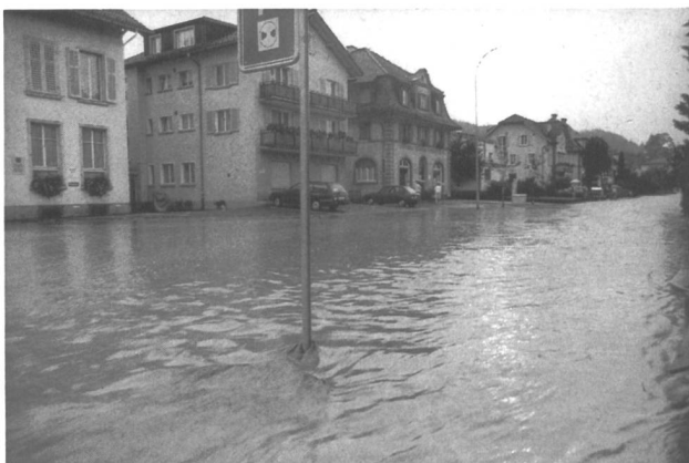
Bild 2. Der Gewittersturm Lea vom 21. Juli 1992 verursachte nebst gewaltigen Hagel- und Sturmschäden auch Wasserschäden in Millionenhöhe. Infolge von Ausbrüchen der Buchwigger wurde das Städtchen Willisau/LU massiv überschwemmt. Das Bild zeigt die Bahnhofstrasse als friedlich dahinmurmelnenden Fluss.

Die erste Julihälfte war kühl und regnerisch. Ab etwa Monatsmitte wurde es heiss, sonnig und trotz einigen Gewittern sehr trocken. Lokale Gewitter verursachten im ersten Monatsdrittel Bachausbrüche wegen verstopfter Strassendurchlässe und eingedohlter Bachabschnitte. In Heimiswil/BE wurde ein Dorfteil überschwemmt und in Mitlei-