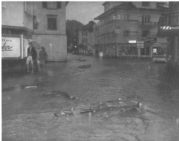
Bild 3. Überschwemmung in Willisau/LU vom 21. Juli 1992. Das Bild zeigt die Situation beim Hotel Mohren zur Vorstadt-Strasse.