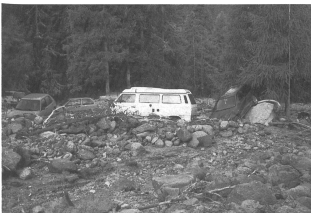
Bilder 4 und 5. S-charl/GR nach dem Unwetter vom 7. August 1992. Über 30 parkierte Autos wurden vom Rüfenniedergang des Sesvonnabaches erfasst und schwer demoliert. Personen kamen glücklicherweise nicht zu Schaden.