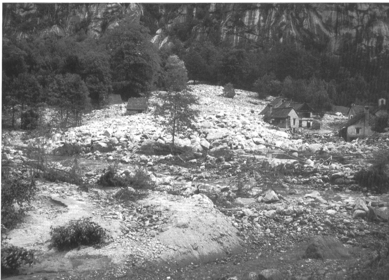
Bild 6. Faèd in Bavonatal/TI nach dem Murgang vom 31. August 1992. Rund 140 000 m 3 Schlamm- und Geschiebmassen ergossen sich über den Weiler. Zwei Personen fanden dabei den Tod.

Sehr mild und niederschlagsreich. Auf der Alpennordseite wurde mit 18 Regentagen (Messstation Zürich) der nässeste November der letzten 20 Jahre gemessen. Im Tessin war es dagegen zu trocken. Die seit Wochen beinahe ununterbrochenen Regenfälle verursachten Mitte November in der Westschweiz einige Überschwemmungen. In der Region Lausanne-Nyon/VD wurden Dutzende von Kellern und Strassen überschwemmt, in der Orbeebene grosse Kulturlächen überflutet. Vom 20. bis 22. November lösten die Dauerregen etliche Rutschungen mit Strassenunterbrüchen aus. Es regnete zwar viel, schwere Sachschäden blieben der Schweiz jedoch erspart. Ein spektakulärer Erdbeben ereignete sich bei Wassen/UR, wo die Gotthard-Autobahn und die Kantonsstrasse für etliche Stunden blockiert wurden. Weitere Erdbeben wurden im Sottoceneri/TI, im Entlebuch/LU und beim Jaunpass auf Berner Seite gemeldet. Im Glarnerland brachen Bäche aus, Kulturland und Strassen wurden überflutet. Gegen Ende des Monats verursachten im Wallis anhaltende Regenfälle mehrere Rutschungen. Zwischen Martigny und Salvan donnerten Felsblöcke in der Grösse von Autos auf die Strasse. Ebenfalls unterbrochen wurden die Strassen nach Emosson und nach Ravoire.