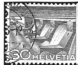
Figura 3. Una tiratura di oltre 1½ miliardi di esemplari è stata raggiunta dal francobollo del 1949. Creato da Karl Bickel, mostra l'accesso all'ospizio del Grimsel sopra il muro di Seeuferegg, l'ospizio e la diga ad arco di Spitalam con il lago del Grimsel.

Figura 4. La centrale e lo sbarramento di Verbois sbarrano la Rhone sotto Ginevra allo scopo di utilizzarne l'energia idraulica. Attualmente sono in atto lavori di trasformazione e di rinnovo della centrale idroelettrica. Il francobollo da 30 centesimi dell'anno 1949 è stato creato da Karl Bickel.