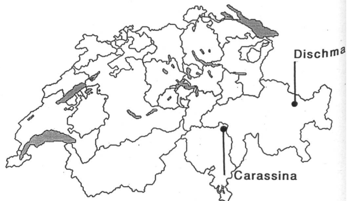
Figure 1. Situation des bassins de la Dischma et de Carassina.