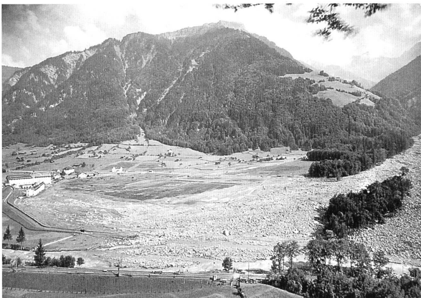
Bild 1. Der Bachausbruch hinterliess eine Schuttwüste und Schäden von einer zweistelligen Millionenzahl.

Das Tal endet in einem von Hausstock und Ruchi umschlossenen Bergkessel, über dem sich in der Nacht des 24./25. August 1944 ein Hagelwetter entlud. Die Sturzbäche fegten den Sulzgletscher vom Schutt blank, und die