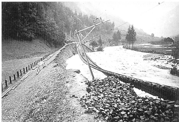
Bild 3. Die Durnagelbachkatastrophe hatte bis ins Glarner Unterland weitere Zerstörungen an Brücken und Fabrikwehren zur Folge und Linthtal war während 54 Tagen vom Bahnverkehr abgeschnitten.

Geröll- und Wassermassen rissen im Tobel auch noch die Berghänge mit. Am Talende fächerte die auf 500 000 m 3 geschätzte Geschiebemasse aus, und auch die hochgehende Linth richtete bis ins Glarner Unterland grossen Schaden an.