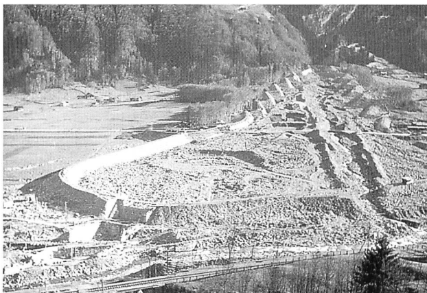
Bild 4. Ein Geschiebesammler, dessen Dämme 2000 m lang sind, umfasst jetzt das Mündungsgebiet des Wildbaches und bietet für die Umgebung einen Schutz (Foto datiert 13.11.1946).

Die Erwartungen in die Verbauungen haben sich erfüllt. Das Bachbett kann sich nicht mehr vertiefen, und die Ufer und Hänge begrünen sich wieder. Was in der Macht von Menschenhänden lag, ist gegen eine Wiederholung des 24. August 1944 getan worden. Das Verbauungswerk bedarf aber weiterhin des Unterhalts, denn es ist gar mancherlei Gefährdungen ausgesetzt.