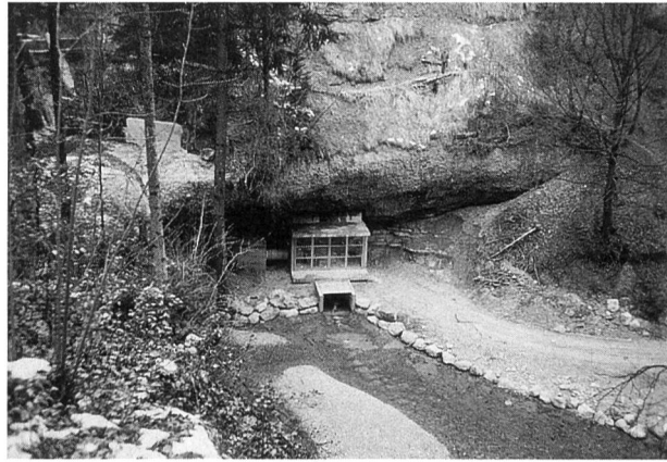
Bild 5. Das Maschinenhaus ist zwecks Besichtigung grosszügig dimensioniert und mit einer Glasfront versehen. Unter die Felsnase des Wasserfalles plaziert, ist es vor Steinschlag geschützt und gut in die Landschaft integriert.

noch verkraftbar. Die Anlage nahm schliesslich, gemäss revidiertem Bauprogramm, am 12. Januar 1996 den Probebetrieb auf. Die provisorische Übernahme durch den Bauherrn, die Genossenschaft «Pro Guggenloch», erfolgte am 30. Mai 1996.