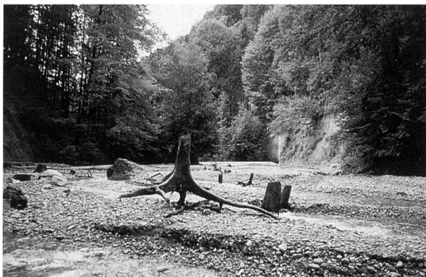
Bild 1. Der abgesenkte und von Schlamm befreite Stauraum. (Foto Iteco, 3. Oktober 1995)

Vor Beginn der eigentlichen Sanierungsarbeiten war es freilich notwendig, zuerst das Geschiebe im Weiher – nach vorherigem elektrischem Abfischen der Unterwasserstrecke – durch das Öffnen der beiden alten Grundablässe auszuspülen. Anschliessend wurden die alten dann durch neue, motorisierte Grundablässe ersetzt.