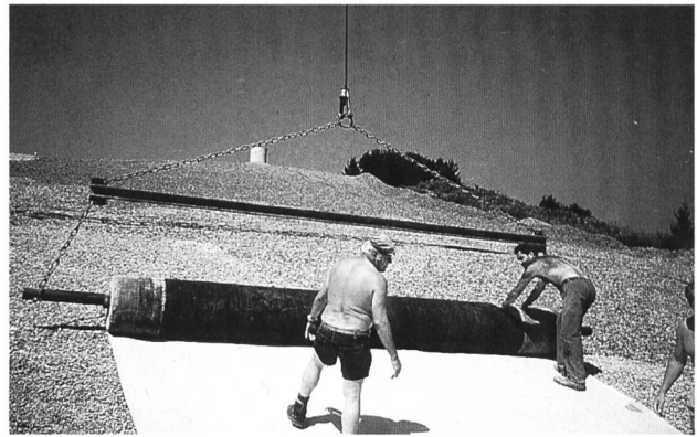
Bild 2. Ausrollen der Dichtungsmatte.