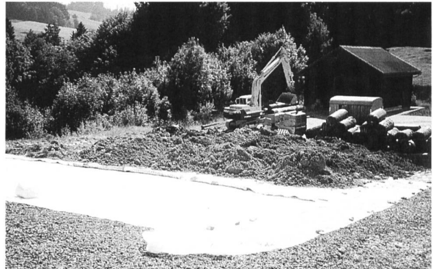
Bild 3. Schüttung der Rekultivierungsschicht.

be wurde die Deponie bis in die 70er Jahre mit Hausmüll gefüllt. Die Schütthöhe beträgt rund 20 m.