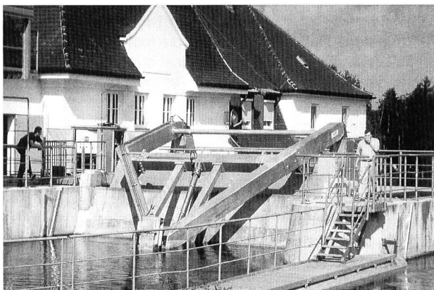
Bilder 1 und 2. Die Rechenreinigungsanlage des Amperkraftwerks Haag.