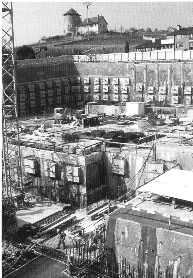
Figure 1. Avec la Tour Bertholoz, la station se trouve en plein site historique. Le Service des eaux de Lausanne était donc tenu de construire très profond. La solution a été d'opter pour une construction souterraine, c'est-à-dire qu'une fois l'usine achevée, seule une vigne sera visible, comme à l'origine. La galerie et le premier radier du bâtiment sont situés à 11 m au-dessous du niveau du lac Léman.