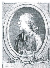
Antoine de Chézy