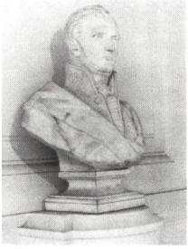
Louis-Marie-Henri Navier (1785–1836)

Ursprünglich versuchte Navier 1819, mit seiner Architecture Hydraulique einen Überblick über die Hydraulik des 18. Jahrhunderts zu geben, in Tat und Wahrheit erreichte er damit jedoch die Überleitung der klassischen Hydraulik in die moderne Hydrodynamik. Wir kennen heute seinen Namen insbesondere durch die Navier-Stokes-Gleichungen als Erweiterung der Euler-Gleichungen. Im Gegensatz zu den letzten beinhalten die NS-Gleichungen den Einfluss der Viskosität, welcher während langer Zeit jedoch falsch interpretiert und erst durch die Grenzschichtgleichungen unter Verwendung der scheinbaren Zähigkeit richtig ins Licht gerückt wurde. Die Entwicklungen von Joseph Boussinesq (1842–1929) und Osborne Reynolds (1842–1912) haben dabei den grundlegenden Erörterungen von Ludwig Prandtl (1875–1953) den Weg in die moderne Hydromechanik geebnet.