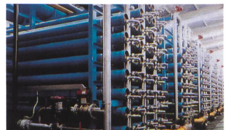
Bild 1. Palma de Mallorca: Entsalzungsanlage nach dem Verfahren der Umkehrosiose mit einer Kapazität von 39 000 m 3 /Tag.

Tag steht kurz vor ihrer Fertigstellung. Gegenwärtig existieren weltweit 12 500 Entsalzungsbetriebe, die insgesamt 20 Mio. m 3 Wasser pro Tag liefern, was 1% der Welttrinkwasserproduktion entspricht. Die Kostensenkungen, welche mit den neuen Entsalzungsanlagen möglich sind, müssten zu einer Verdoppelung des Weltmarktes auf diesem Gebiet führen, dessen Wachstum in den kommenden zwanzig Jahren auf mehr als 70 Milliarden Dollar geschätzt wird. Für die nächsten fünf Jahre sind weltweit bereits 10 Milliarden Dollar für die Installation von Entsalzungseinheiten geplant, die insgesamt 5,3 Mio. m 3 pro Tag produzieren.